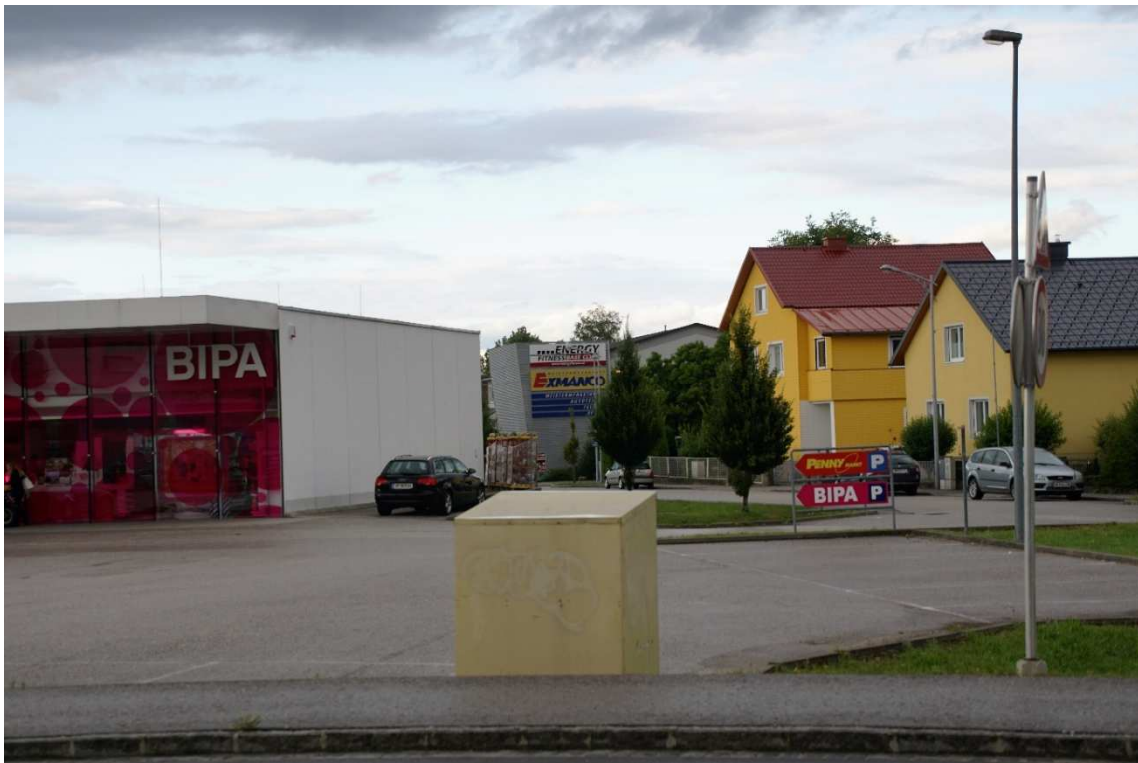
Ansicht von Nord – Kriemhildstraße Richtung Südwest